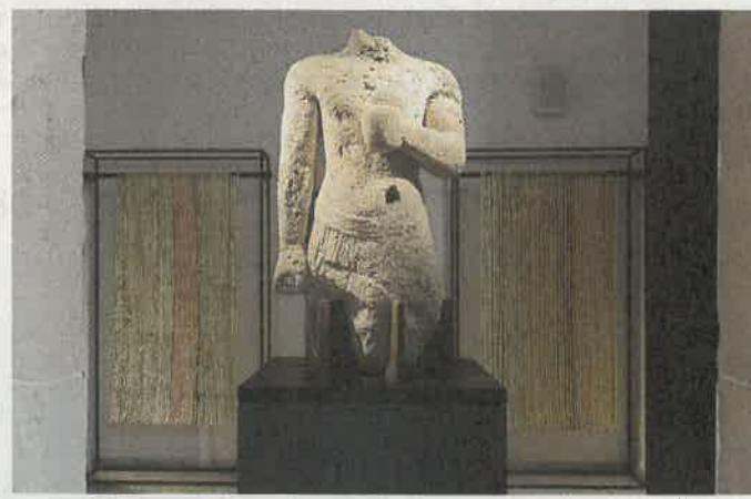
Ο Ελληνικός πολιτισμός αποτέλεσε εκκίνηση στην έμπνευσή της.

Η έκθεση στο Παλέρνο εστιάζει στην «Υλη». Η Δημητρακοπούλου έχει πειραματιστεί με πολλά υλικά και δίνει μεγάλη έμφαση στην πρωταρχική άμορφη μάζα που σταδιακά αποκτά πνοή και υπόσταση, χάρις στην «αλχημεία» της καλλιτεχνικής δημιουργίας. Στη Σικελία ταξίδεψαν μια πλειάδα θεών, ηρώων, πολεμιστών, η Γαία και ο Ήλιος, ο Αγαμέμνων και ο Πέλοπας. Γλυπτά σε ορείχαλκο ή σε φαιστιεακή πέτρα. Μαζί τους μαρμάρινα δόρατα. Ολα αυτά συνυπάρχουν με μανδύες από κινεζικό χαρτί με φυλακτήρια λόγια αγάπης, έρωτα και ελπίδας. Δεν είναι η πρώτη φορά που η εικαστικός έλκεται από το κέλυφος αλλά και το περιεχόμενο ενός αρχαιολογικού μουσείου. Το έργο της «Προμαχώνες» άνοιξε έναν ιδιότυπο